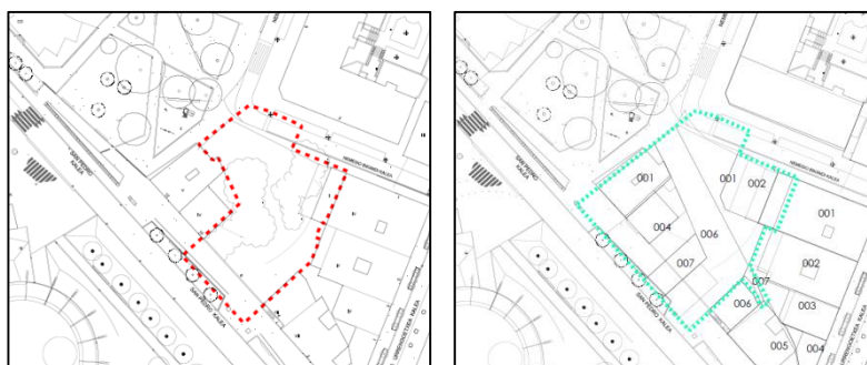
Imagen 2. Superficie actual (izquierda) y ampliación propuesta (derecha)